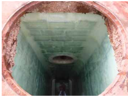
Blick in den sanierten Schacht. Lose Abdeckung, die nicht zu sanieren war, wurde wieder aufgelegt.