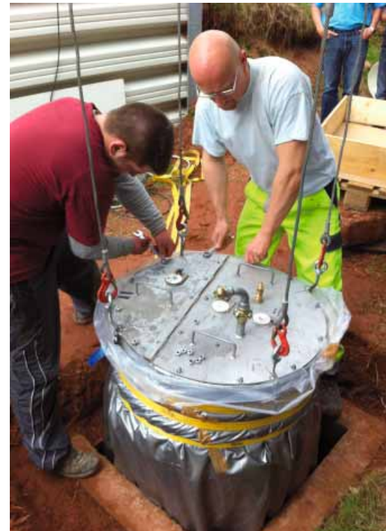
Anschluss der Druckluft an Ventil zum Aufstellen des Vertiliner mit Luft. Anschließend wurde die Lichterkette eingelassen und der Schlauch ausgehärtet.

gewählt. Nach Aushärtung hatte der Schlauch einen Abstand zu den Eckpunkten von ca. 3 bis 4 cm und bildete damit eine Ausrundung, die für den Bauherrn durchaus akzeptabel war. Der Hohlraum in den Ecken wurde im Anschluss auf der kompletten Linerhöhe verdämmt. Zu- und Ablaufrohr sowie die Anschlüsse wurden mit Handlaminat eingebunden. Ergebnis war eine