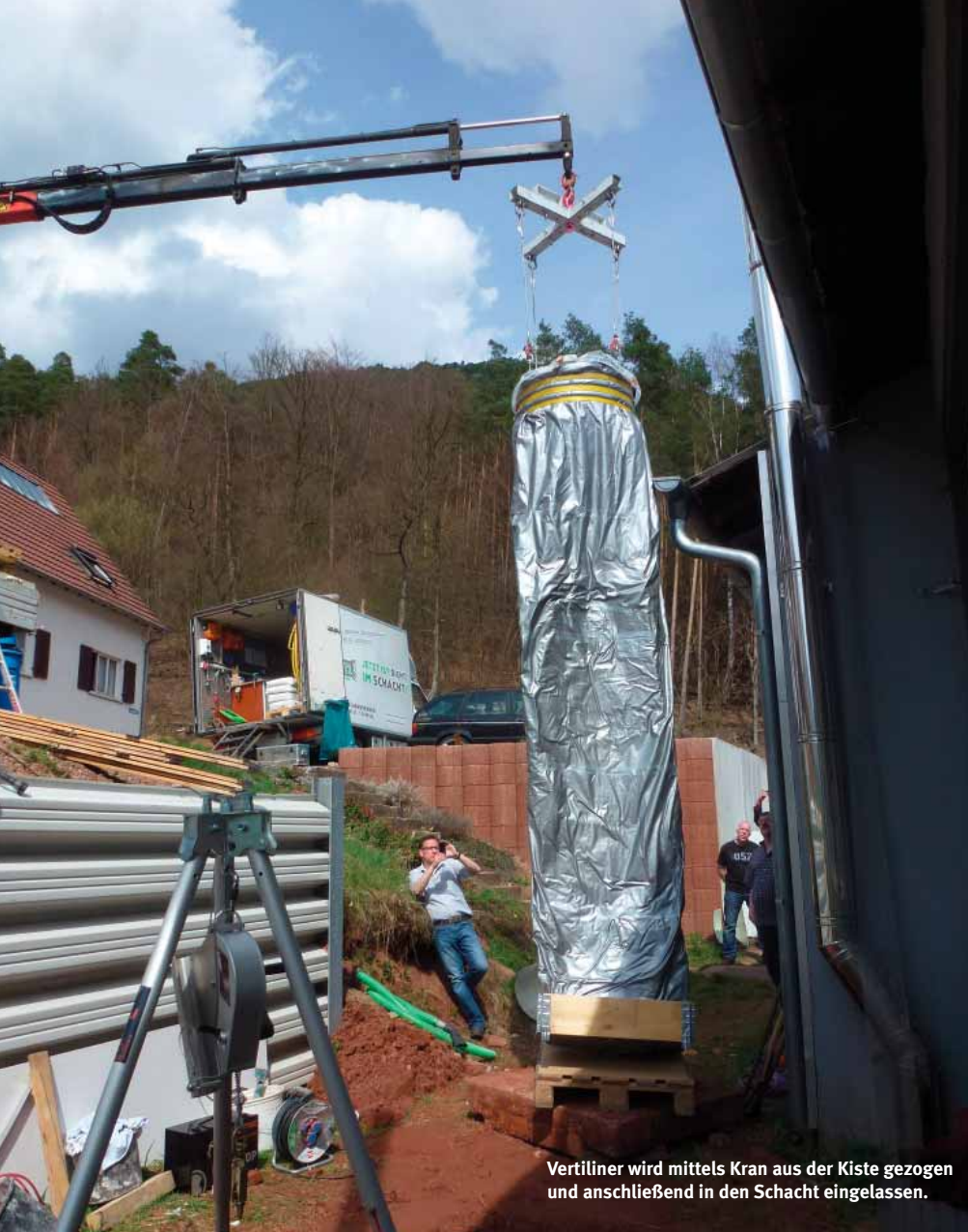
Vertiliner wird mittels Kran aus der Kiste gezogen und anschließend in den Schacht eingelassen.