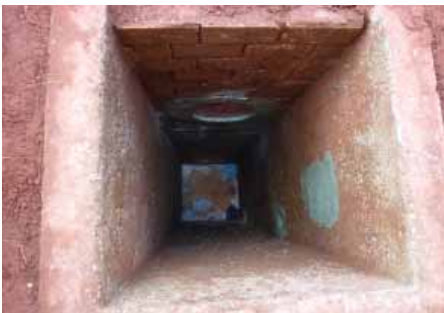
Blick in den Schacht nach Vorarbeiten. Steigeisen wurden entfernt. Auswölbungen in Folge Korrosion angeglichen. Defekte Schachtsohle und Gerinne wurden entfernt bis auf gewachsenen Boden. Eingelegte Bretter dienten als Einbauhilfe und wurden nach Einbau des Vertiliner wieder entfernt.