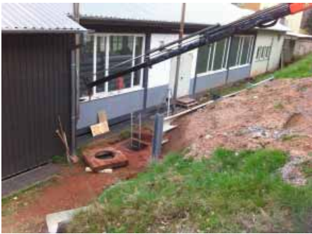
Baustelle vor Einbau des Vertiliner während der Vorarbeiten. Zu sanierender Schacht sitzt unmittelbar vor Gebäude. Lose Schachtabdeckung wurde entfernt.